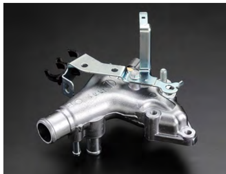
ハウジングASSY(アウトレット)