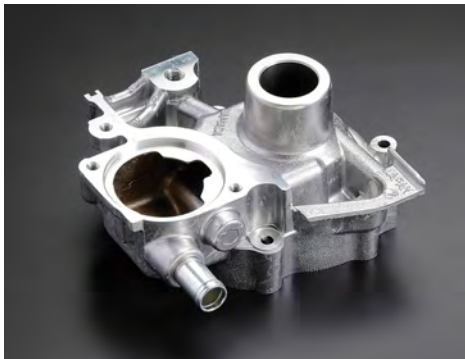
ケース(ウォーターポンプ)