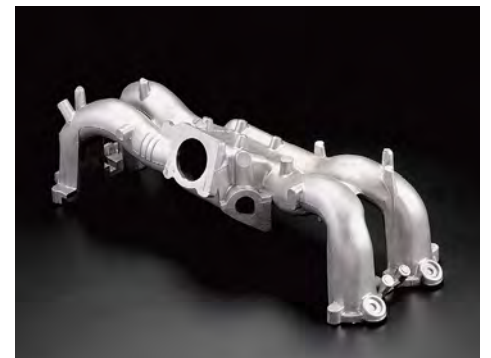
マニホールド(インテーク)