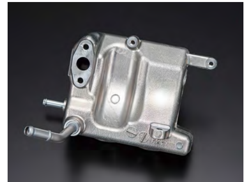
タンクCP(オイルキャッチ)