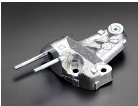
パイプCP(エアサクシオン)