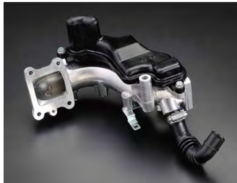
ダクトASSY(エアインテーク)